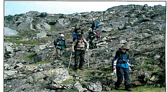
Ned fra Kufjellet.

Vi går opp fra Stor-Ballangen. Vi går opp stien i Stridalen og opp «skjerperstein» mot Blåfjell. Vi passerer flere skjerp på vegen opp. Turleder: Ingolf Kvandahl.