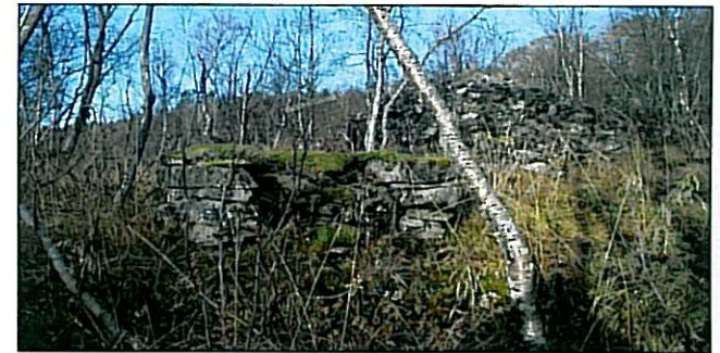
Gruva i Melkedalen.