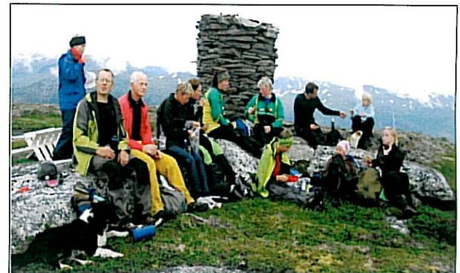
Pause på Njallavardu.