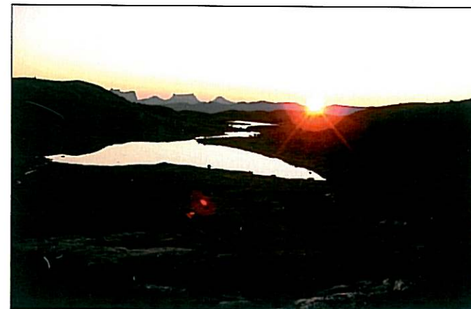
Utsikt fra Sepmol.