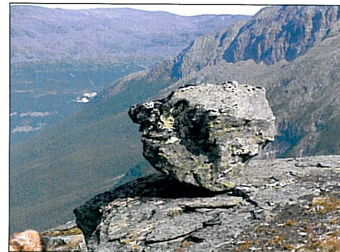
Vokter fangstgjerdet på Bomeidet.