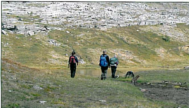
Tur opp Rauvassdalen.